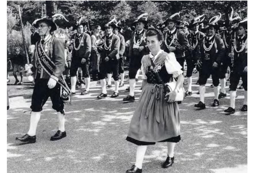
De Wiltener Stadtmusikkapelle uit Innsbruck tijdens de marswedstrijd (Internationaal Muziek Concours 1951).