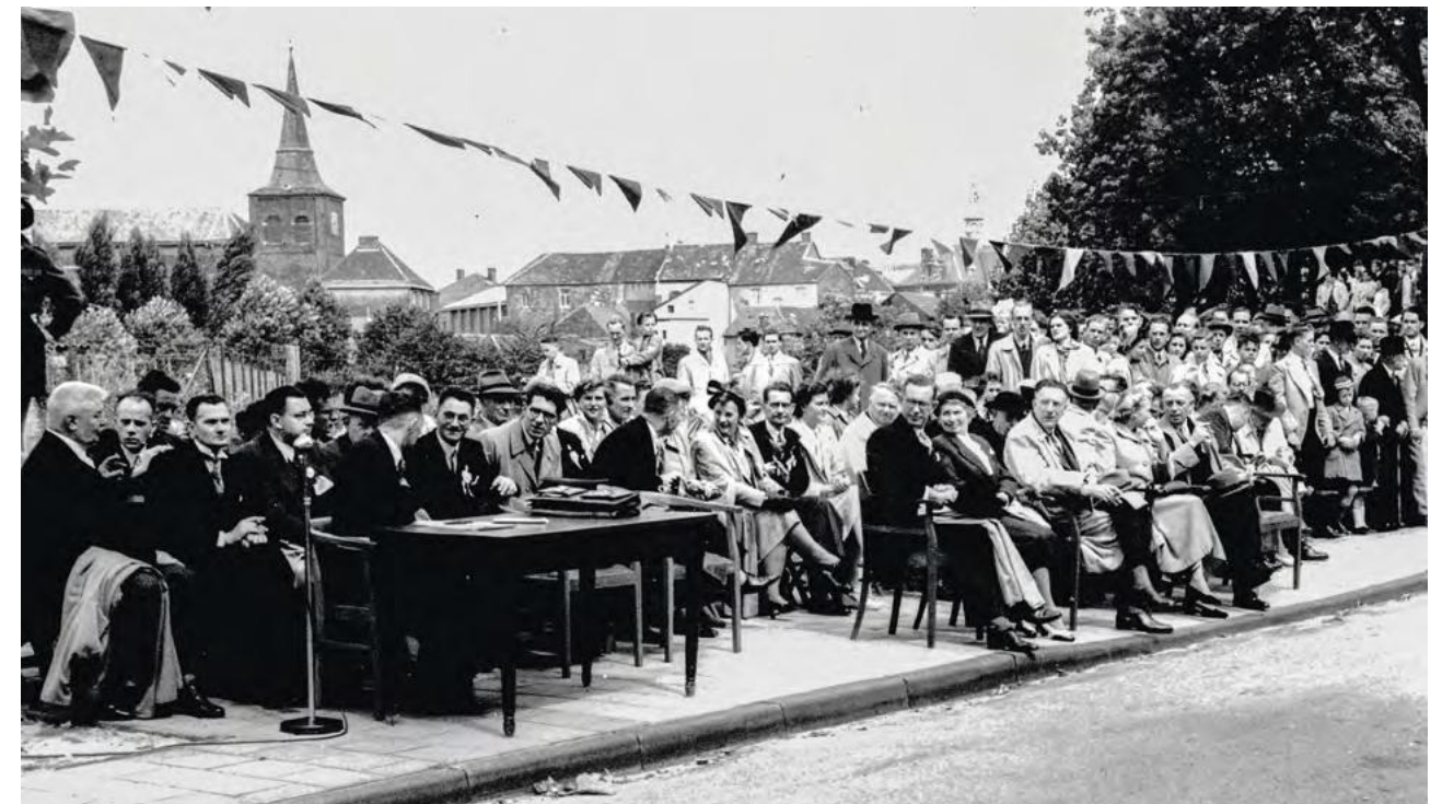
Vips in afwachting van een muziekkorps voor de marswedstrijd aan de Stationstraat. Op de stoelen vooran: links burgemeester Becht en twee stoelen verder minister van Verkeer Wemmers. Op de achtergrond de skyline van het centrum.