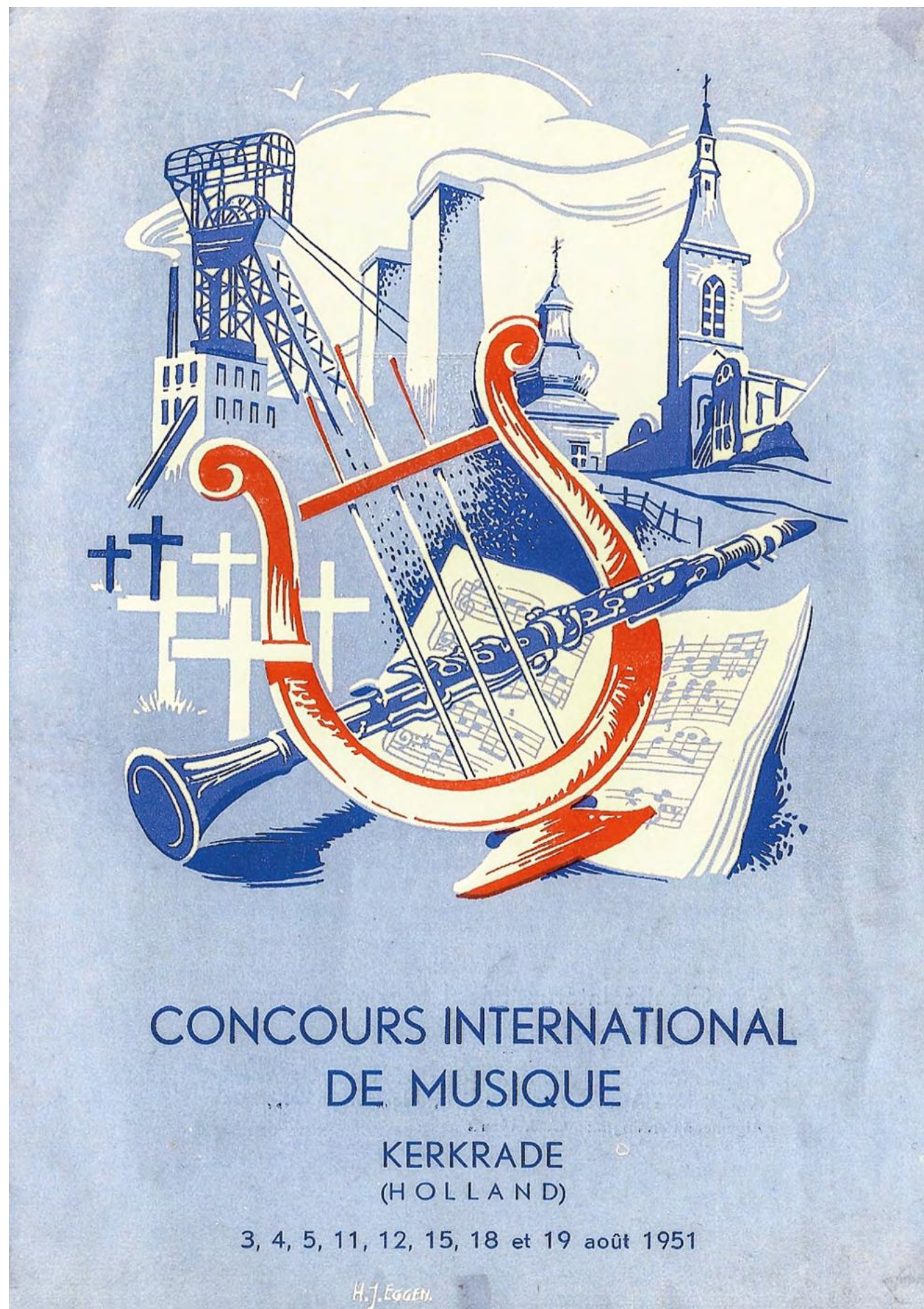
Brochure Internationaal Muziekconcorso 1951.