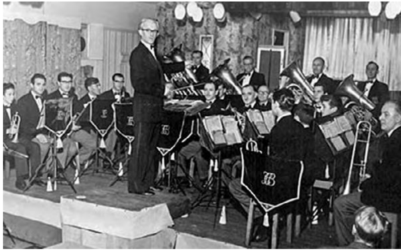
Deze band is de aanleiding geweest voor de oprichting van het Wereld Muziek Concours. Hun bezoek in 1949 aan de Harmoniën St. Pancratius en St. Aemiliaan leidde tot het idee om een groot internationaal muziekconкурс te organiseren. Dit vond voor de eerste keer plaats in 1951. Bij gelegenheid van het 60 jarig bestaan van het WMC in 2011 keerde deze band terug in Kerkrade en gaf een Galaconcert in de Rodahal.

tionaal muziekconкурс organiseren. De initiatiefnemers wendden zich tot burgemeester Lempers, die enthousiast is over het idee. Hij stelt voor om alle Kerkraadse muziekkorsten bij de organisatie te betrekken, om een zo groot mogelijk draagvlak in de gemeenschap te krijgen. Hiermee was de basis gelegd voor wat later het Wereld Muziek Concours zou worden.