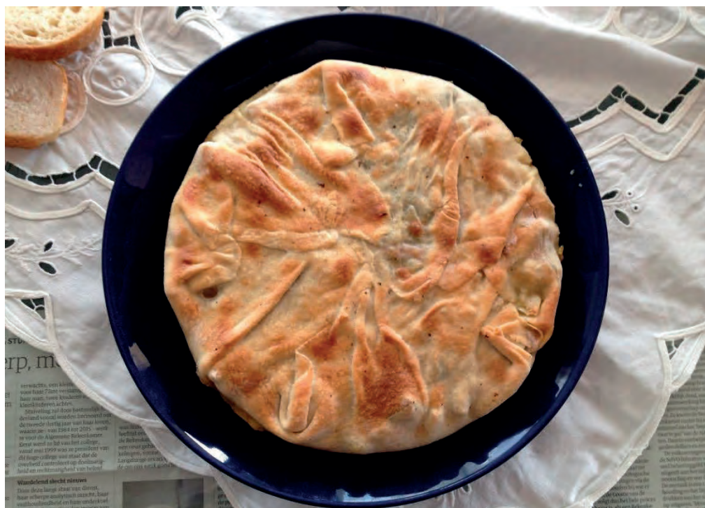
Foto 30 Hartige Paastart

Als de taart goed gaar is, laat die gemakkelijk los uit de vorm en is stevig genoeg om op een bord te wippen. Snijd aan op tafel.