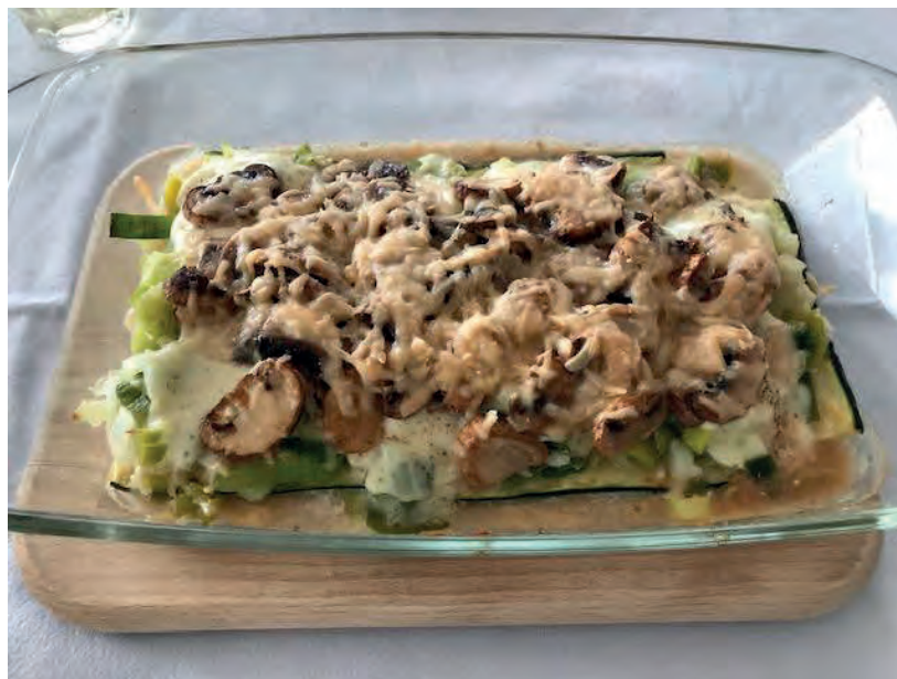
Foto 22 Ovenschotel met courgette, prei en champignons

Dien warm op en snij in stukken in de schotel om die er met een spatel uit te kunnen scheppen op de borden, alsof het lasagne betrof.