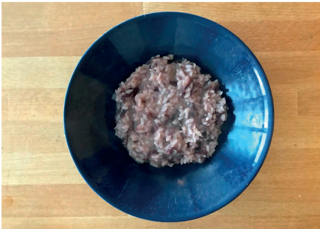
Foto 14 Risotto van radicchio

Dien op direct uit de pan op het bord en geef er géén geraspte kaas bij.