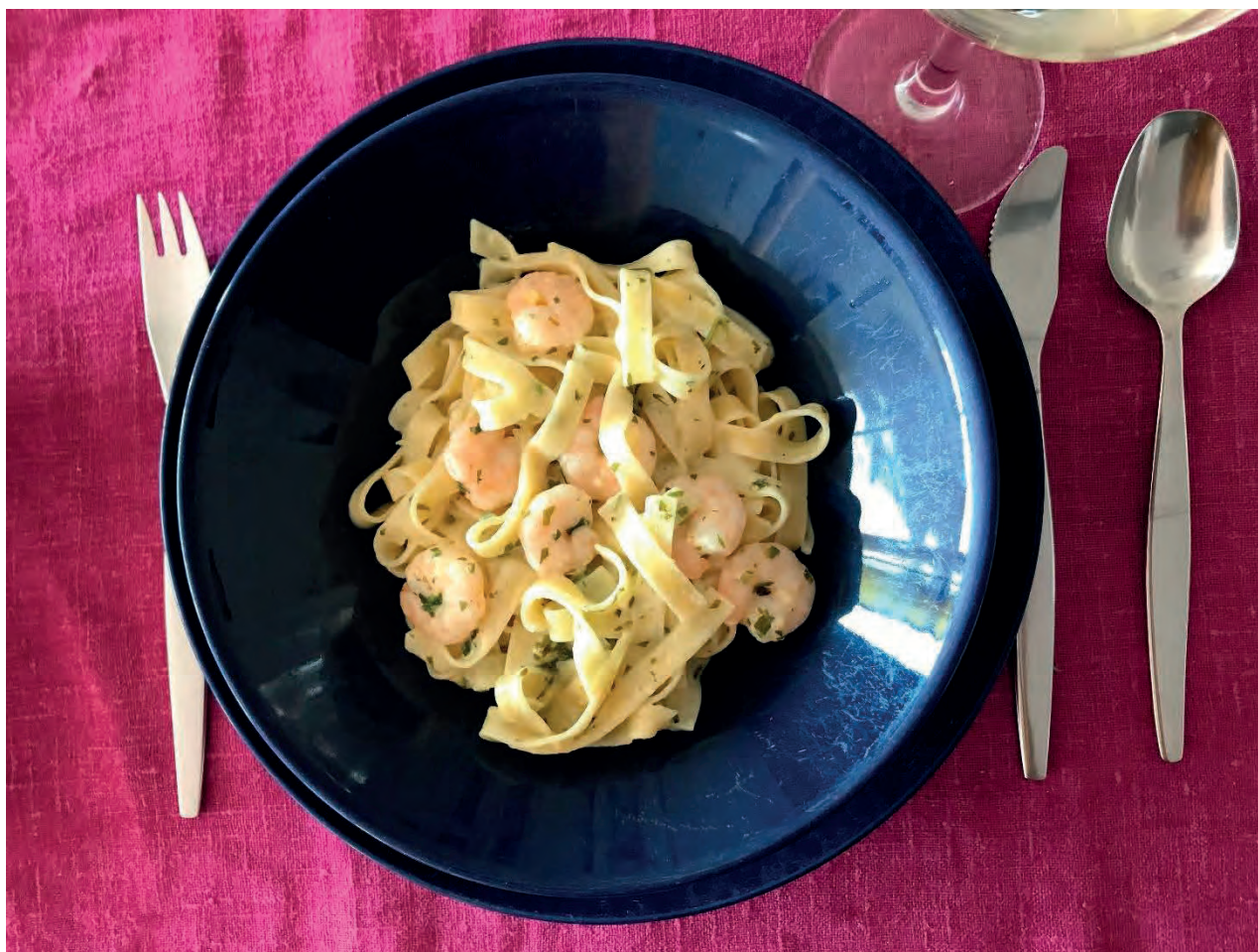
Foto 18 Tagliatelle met citroen en garnalen

Strooi op het laatste moment de gesneden peterselie over het gerecht in de pan en roer nog een keer door.