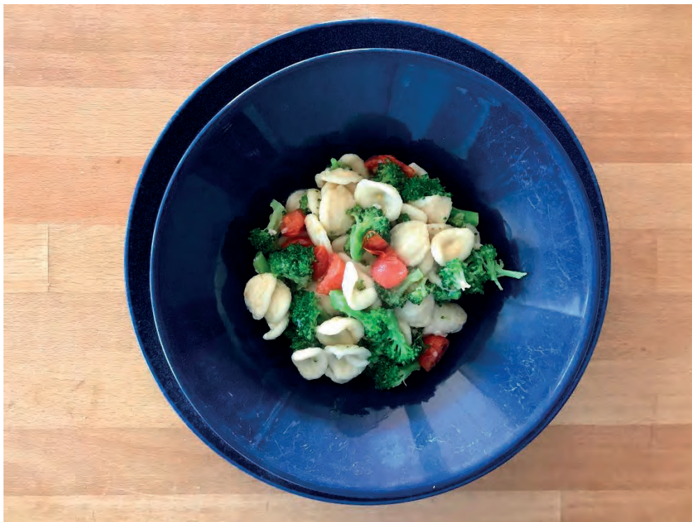
Foto 10 Orecchiette met broccoli en kerstomaatjes

Laat ieder naar smaak geraspte kaas op het bord toevoegen.