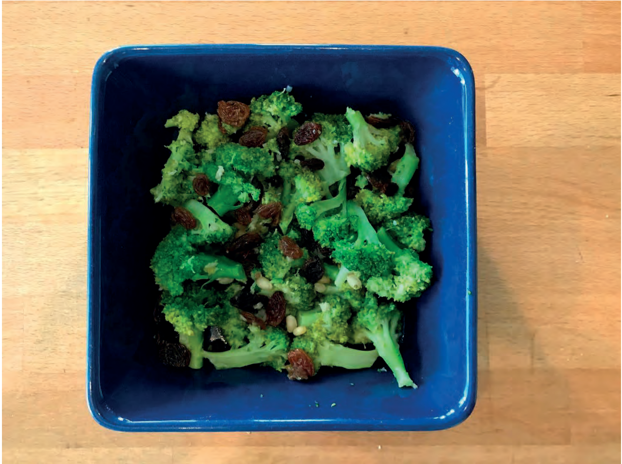
Foto 4 Broccoli met rozijnen en pijnboompitten